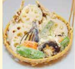
れんこんと野菜の天ぷら …………… 660円