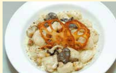
茨城産レンコンの ニョッキ 〜数種キノコと サルジツチャの ゴルゴンゾーラ クリームソース〜 …………… 1,518円