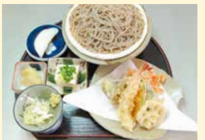
天せいろ …… 1,500円