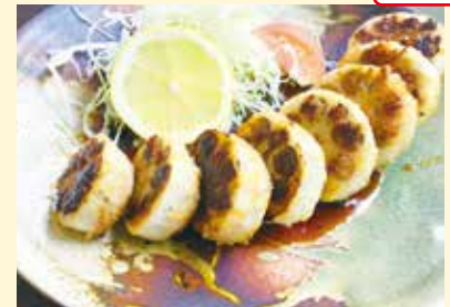
れんこん丸ごと 肉詰め照り焼き …………… 1,100円