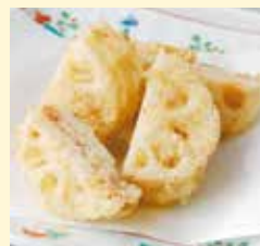
れんこんのはさみ揚げ (1人前) …… 300円