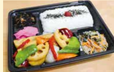
鶏と季節野菜の黒酢あんかけ弁当... 650円