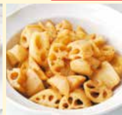
れんこんのきんぴら 1パック (約100g) 250円