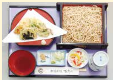
レンコン変り揚げ天セイロ (そば又はうどん) …………… 1,320円