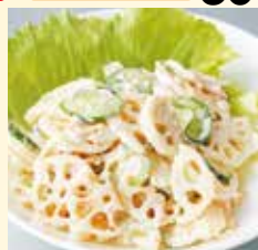
れんこんのサラダ 1パック (約100g) 250円