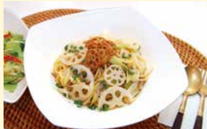
蓮根パスタ (サラダ・コーヒー付) …………… 1,200円