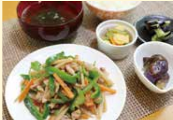
れんこん肉絲 (ロースー) ..... 1,100円