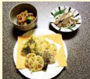
はすの天ぷら... 800円 ガメ煮..... 600円 酢ばす..... 500円