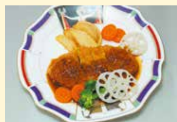
ポークメンチレンコン添え …… 880円