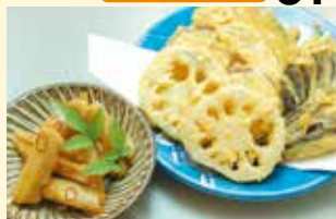
レンコン入り野菜天ぷら (単品) 700円 タタキレンコン煮 (単品) … 500円