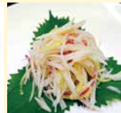
れんこんと青山椒の 和えもの..... 1,200円