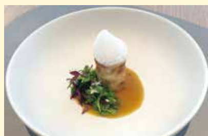
蓮根のルーロー ソースムートルド 14,300円コースの一品として