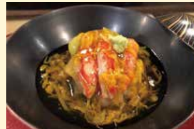
◀ずわい蟹れんこん菊花蒸し ..... 1,320円 ・れんこんしんじょうはさみ揚 ..... 1,320円 ・厚切りれんこんフライ ..... 880円