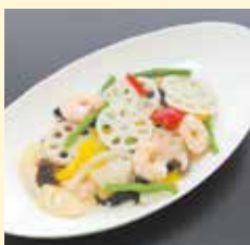
れんこんと海老の 中華風炒め …… 880円