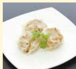
れんこんしゅうまい …………… 660円