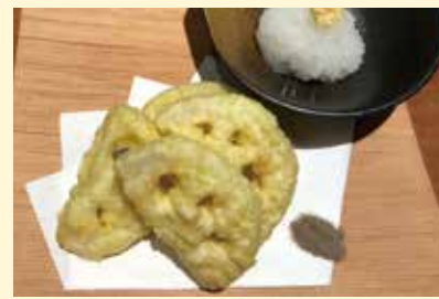
茨城県産蓮根の天ぷら ..... 380円