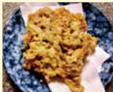
◀はすと 桜海老かき揚 ..... 900円