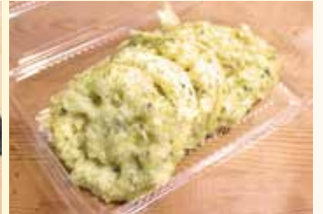
れんこん磯部揚げ..... 300円