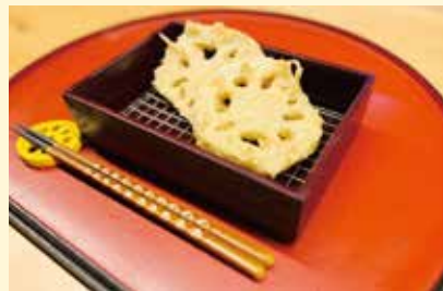
◀れんこんの天ぷら ..... 300円