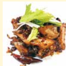
れんこんの中華風つくだ煮 ..... 1,800円