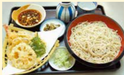
レンコンの天ぷら入り (そば・うどん) … 1,400円