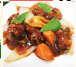
れんこん入り酢豚 ..... 2,200円