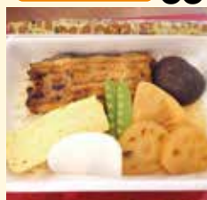
れんこんのうま煮入り あなご弁当 …… 1,650円