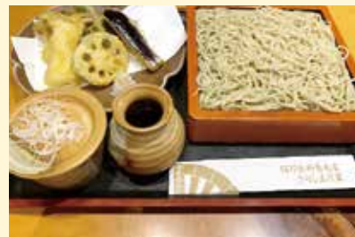
◀秋野菜天ぷらそば ..... 2,000円