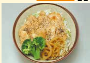
レンコンと若どりの照焼丼 …… 880円