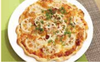
れんこん和風ピザ..... 1,000円 (テイクアウト) ..... 1,100円